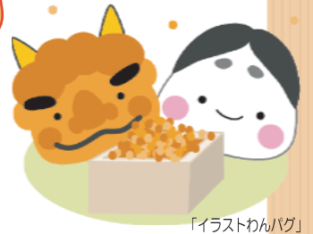
「イラストわんぱう」

2月といえは一年で一番気温が低い月ですよ。1月があまりにも寒かったので、「もういいよ」って言うのが本音です(；_；) こう寒いと～室内では暖房を入れる→空気が乾燥する→加湿器をつける→パソコンに影響ないのかしら?と思った事はないですか? ほとんどのパソコンは許容湿度が80%ほどだからで～一般的な加湿器では70%越える事はないので真横に置かない限り～大丈夫との事。ほっ。